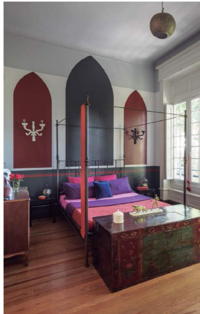
Casi la mitad del mobiliario de la casa fue traída por Roberto de su casa en Roma. Al igual que el adquirido en Uruguay, fue comparado en ferias de barrio, donde se consiguen a veces cosas interesantes para algunos aunque desvalorizadas por otros.