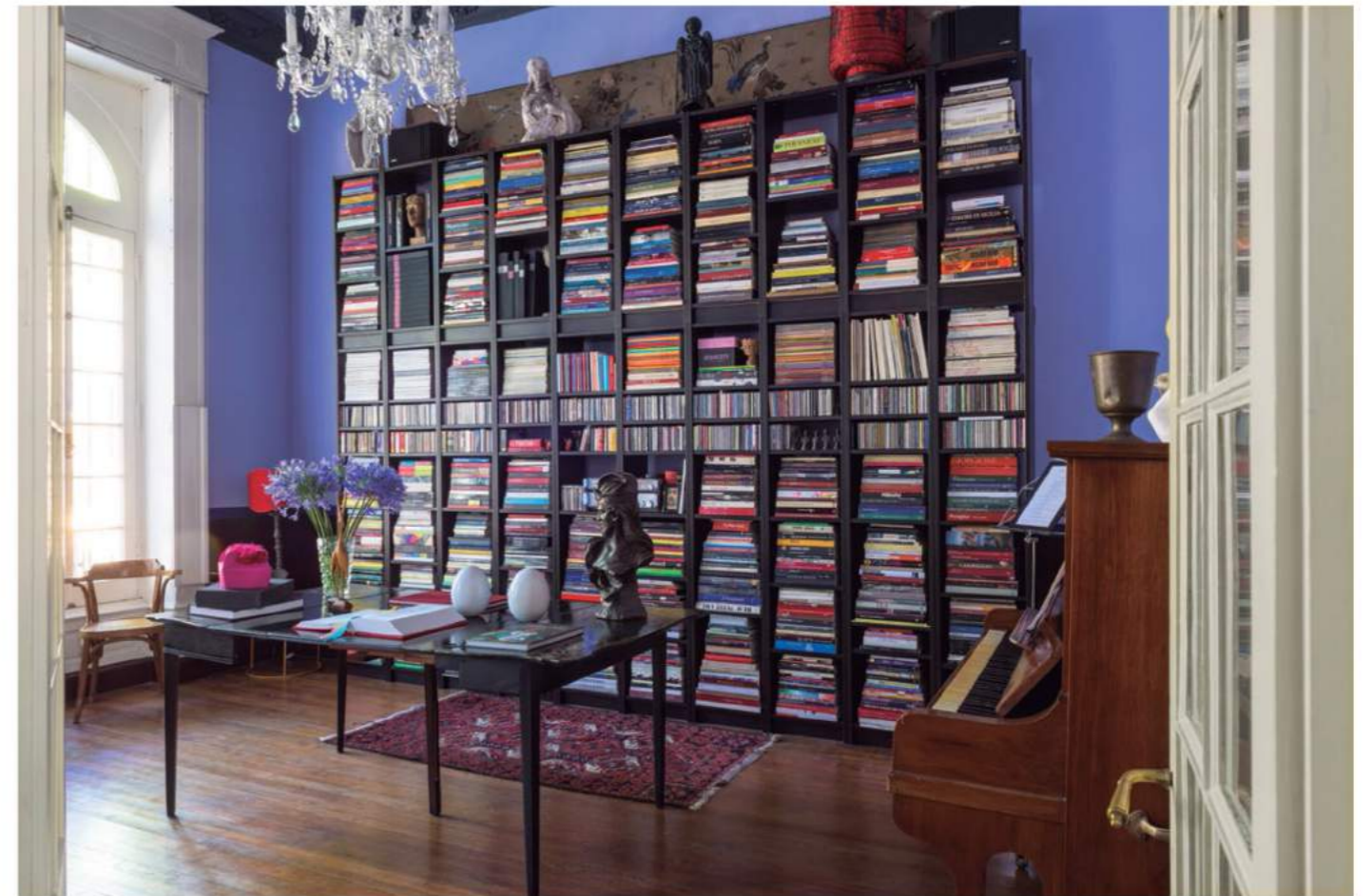
La biblioteca, con casi mil ejemplares, tapiza una pared casi entera. Los libros refieren principalmente al arte, y Roberto los atesora con cariño.