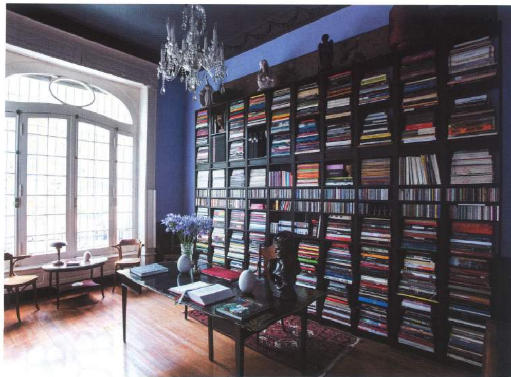
Por MARINA BARRIENTOS